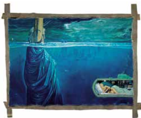
Mark Verlan New York under Water, 2003