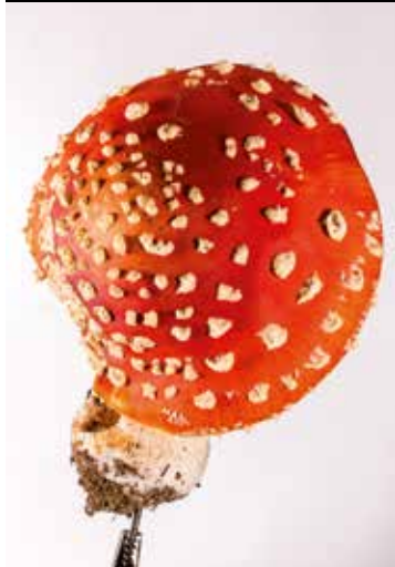
Pilze; Landesmuseum Niederösterreich