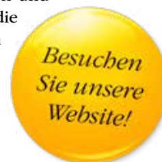
Ihr Friedrich Faulhammer

Alle Ausgaben von upgrade gibt es auch im Internet: www.donau-uni.ac.at/upgrade