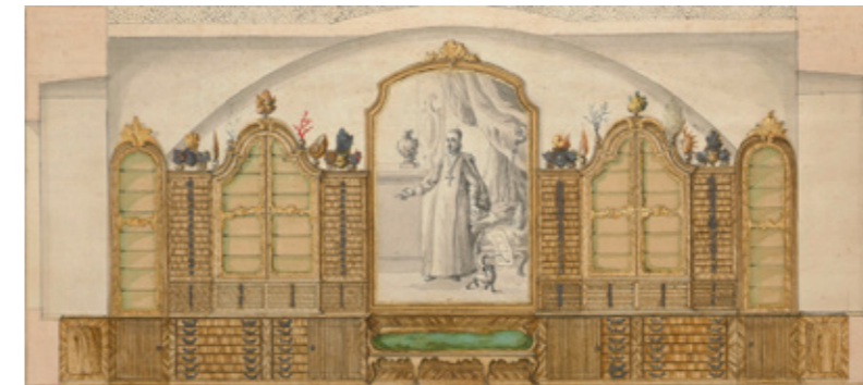
Ausschnitt aus dem Entwurf für die Möblierung des Naturalienkabinetts von Pater Joseph Schaukegl, 1766

Bei der ersten Gegenüberstellung des historischen Quellenmaterials mit dieser Dokumentation fallen bereits einige signifikante Unterschiede zwischen dem Raum in seiner heutigen und in seiner ursprünglichen Erscheinung ins Auge: So zeigt Schaukegels Entwurf von 1766,