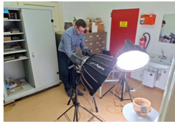
3D-Digitalisierung einer kupferzeitlichen Schüssel

Zu frühmittelalterlichen Gräbern stehen über die Datenbank THANADOS 3 zahlreiche Datensätze zur Verfügung, die nicht nur Fundstellen und Befunde, sondern auch einzelne Grabbeigaben beschreiben. Bei den im Projekt berücksichtigten Gräberfeldern wurden diese Beigaben durchfotografiert und die Inventarisate miteinander abgeglichen. Hier handelt es sich um ein Beispiel für die Vernetzung bzw. Kontextualisierung ei-