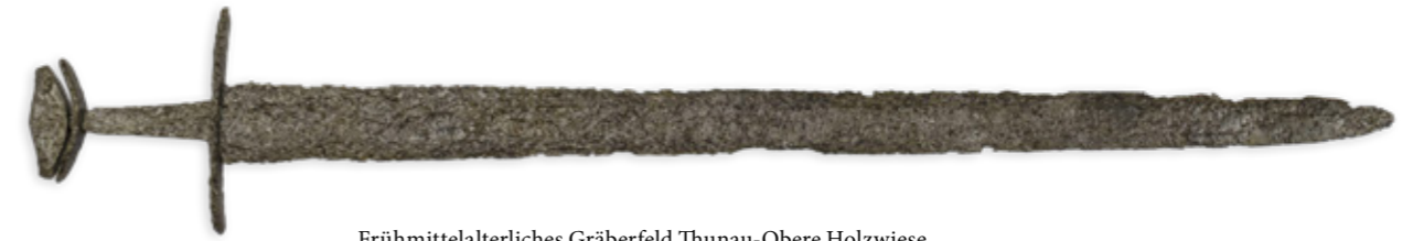
Frühmittelalterliches Gräberfeld Thunau-Obere Holzweise, Spatha aus Grab 129 (Inv.Nr. UF-19020.36000)

Andererseits sind über den Projektabschluss hinaus zusätzlich zur Präsentation im Internet viele weitere Formen der Nutzung zu erwarten. Dazu zählt beispielsweise die Verwendung in Ausstellungen, etwa in Medienstationen oder über QR-Codes, da in 3D-Visualisierungen feine Details oder komplexe Formen oft besser zu erkennen sind als auf Fotos oder Originalfunden in Vitrinen.