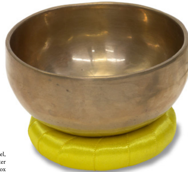
Klangschale mit Klöppel, torusförmigem Auflagepolster und Aufbewahrungsbox (Inv.Nr. VK-28370/7)

Die Hoffnung auf das Gebet und spirituelle Schutzmächte ist dort von größter Bedeutung, wo mit Handeln kein Einfluss auf das Geschehen genommen werden kann; so ist es nicht verwunderlich, dass gerade das Wetter einen wichtigen Gegenstand im Spektrum der Wünsche an höhere Mächte darstellt. Es ist als Faktor für das Gedeihen der Feldfrüchte Bezugsrahmen der Gebete für einen guten Ernteertrag. Darüber hinaus kann es bei extremen Wetterlagen auch eine unmittelbare Bedrohung für Hab und Gut sowie Leib und Leben darstellen. Neben dem Gebet und dem Gottesdienst als Instrumenten einer direkten Wendung an die höhere Macht waren vermeintlich apotropäisch wirkmächtige Gegenstände besonders in der Zeit bis zum Ende des 19. Jahrhunderts weit verbreitet. Neben einfachen Amuletten, Segen oder Amulettzetteln sind besonders die Universal- bzw. Komposit-Amulette zu beachten, die in teilweise enormer Dichte unterschied-