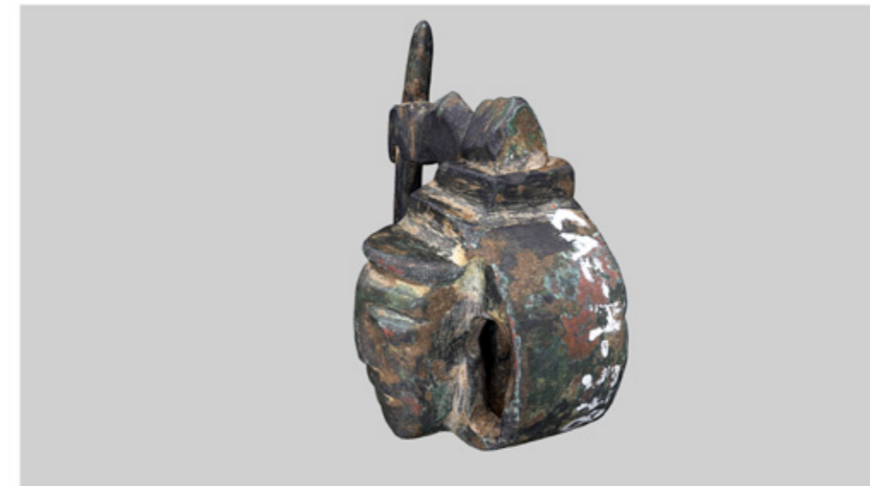
Padlock with mask cover 3D-Modell