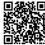
Das Maskenschloss in den Landes- sammlungen Niederösterreich Online