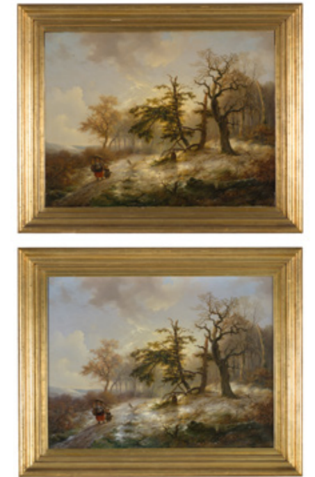
Beim Vergleich der Aufnahmen (oben Vorzustand) ist die veränderte Farbwirkung nach der Restaurierung (unten) deutlich zu sehen.

Für die Anpassung des Lichtmaßes des Zierrahmens wurde eine Fichtenholzleiste mit gerundeter Kante in mehreren Leim-, Kreide- bzw. Schellackaufträgen vorbereitet und mittels Ölvergoldung gefasst. Durch das anschließende Anbringen der Einlageleiste und die Modifikation der Montage konnte eine optimale Positionierung des Gemäldes im Zierrahmen erreicht werden.