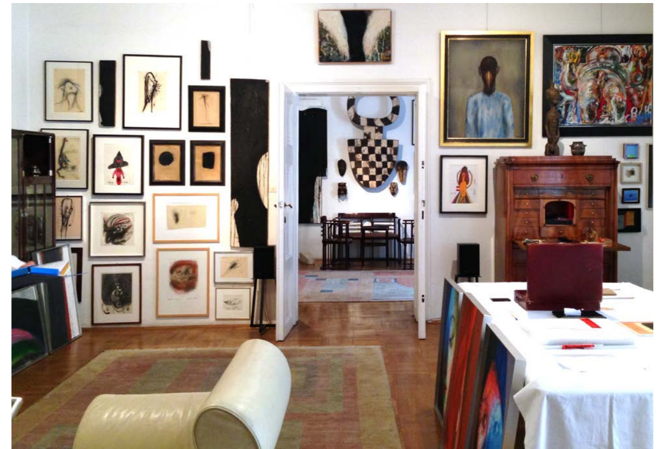
In Zambos Wiener Wohnung, 2014